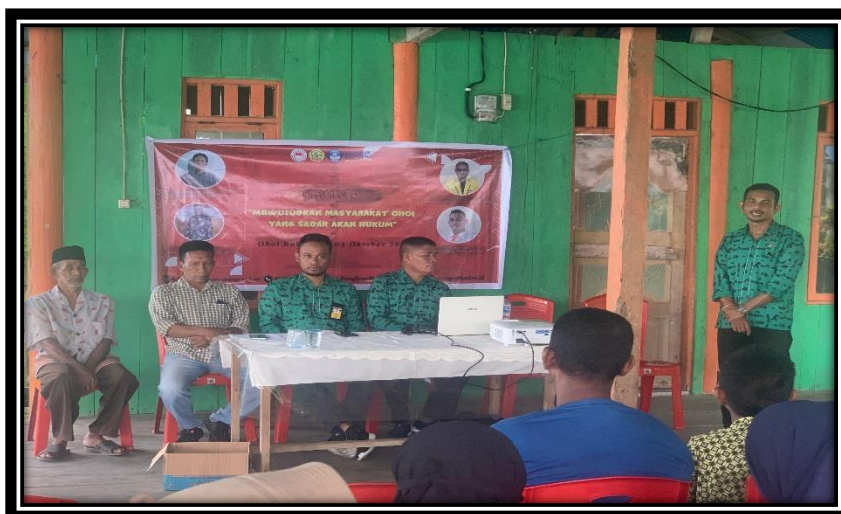
Feedback Positif dari Masyarakat

Kegiatan pengabdian masyarakat dengan judul “Mewujudkan Masyarakat Desa yang Sadar Akan Hukum” yang dilaksanakan di desa Rahareng, kecamatan Kei besar dilaksanakan berdasarkan beberapa alasan yang melatar belakangi adalah salah satunya pendidikan hukum yang terbatas. Pelaksanaan pengabdian kepada masyarakat mendapat respon baik dari masyarakat desa Rahareng dengan antusias, hal ini buktikan dengan masyarakat menunjukkan pemahaman yang lebih baik tentang hak dan kewajiban hukum, terlihat dari partisipasi dalam diskusi dan kegiatan penyuluhan, selain itu juga meningkatnya jumlah warga yang terlibat dalam kegiatan hukum, seperti mediasi konflik dan penyuluhan, menciptakan rasa kepemilikan dan tanggung jawab dan juga tersedianya layanan konsultasi hukum yang membantu masyarakat dalam menyelesaikan masalah hukum yang dihadapi.